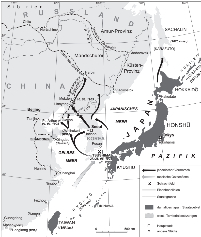
Karte 1: Der ostasiatische Kriegsschauplatz