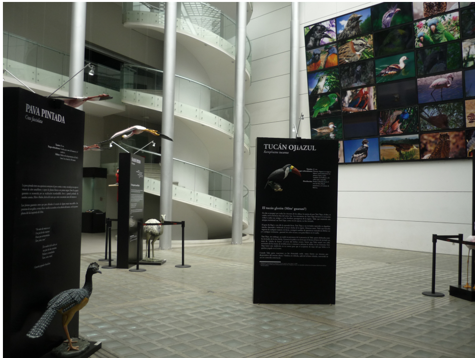
Figura 2. Instalación de aves en el Patio Siglo XXI en la exposición El poder de las plumas (Foto: Naomi Rattunde, 2015).

acompañadas por paneles sobre mitos regionales acerca de ellas (Figura 2). La sala al lado izquierdo del patio estaba dedicada a los procesos de producción (Figura 3), y en la sala derecha se exponían los productos acabados, que incluía las formas de uso y otros elementos de la socialización de los objetos, organizados ahí cronológicamente en arqueológicos, históricos y etnográficos, por regiones y/o por temáticas de uso.