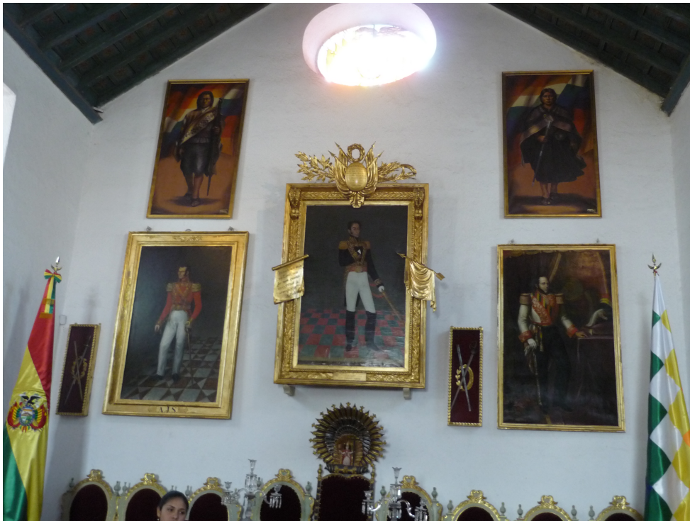
Figura 4. Héroes y heroína nacionales Simón Bolívar, Antonio José de Sucre, José Ballivián, Túpac Katari y Bartolina Sisa en la testera principal del Salón de la Independencia (Foto: Naomi Rattunde, 2015).

los cuadros se instalarían solo temporalmente para los días festivos, la CDL recibió críticas tan severas que la FCBCB se vio obligada de intervenir y apoyar al museo ante la “resistencia tremenda” de habitantes “súper conservadores” y “racistas” de la capital (Carvalho Oliva 2015).