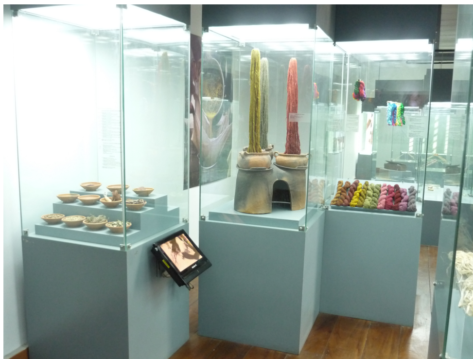
Figura 3. Proceso del teñido con pigmentos, tintes y mordientes, ollas para teñir y fibras teñidas en la exposición La rebelión de los objetos. La cadena operatoria del textil.

además, el enfoque central del segundo ciclo de exposiciones grandes iniciado en 2019 con Vistiendo memorias .