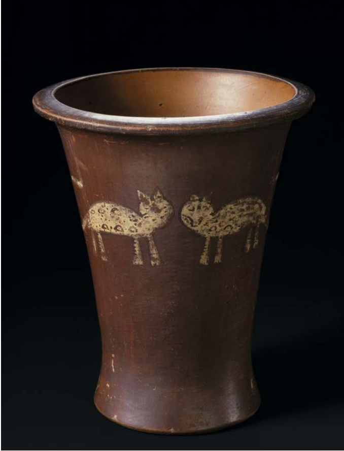
Abb. 2: Quero (Ethnologisches Museum Berlin, VA 8110), Keramik mit Bemalung (katzenartige Tiere), 14,4 x 12 x 12 cm, inkaisch, aus dem Raum Cuzco, Peru.