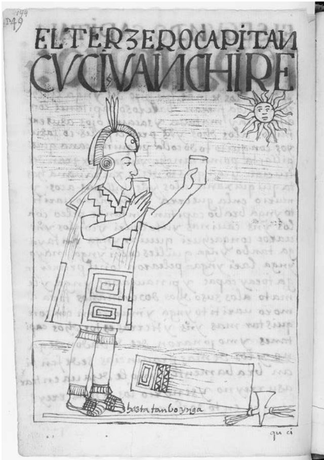
Abb. 5: Zeichnung (inkaischer Heerführer trinkt der Sonne zu), Felipe Guaman Poma de Ayala, Nueva corónica y buen gobierno 1615, f. 149 [149], Königliche Bibliothek Kopenhagen GKS 2232 4 o .