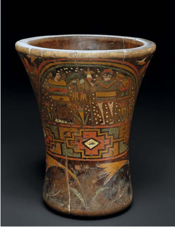
Abb. 3: Quero (Ethnologisches Museum Berlin, VA 12493), Holz mit Lack-Inkrustationen (inkaisches Paar/Herrscherpaar, der Mann mit Lanze und Schild, darunter Tocapus und Band mit Blumen), Höhe 18,8 x 15,8 x 10,5 cm, Region am Ostufer des Titicacasees, Departamento La Paz, Bolivien.