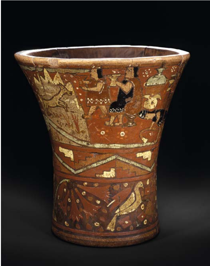
Abb. 4: Quero (Ethnologisches Museum Berlin, VA 63959), Holz mit Lack-Inkrustationen (Opferszene, Mann und Frau opfern den wasserspendenden Bergen Maisbier aus Queros, darunter Tocapus und Band mit Vögeln und Blumen), 21,3 x 20,1 x 13 cm, aus dem Raum Cuzco, Peru.