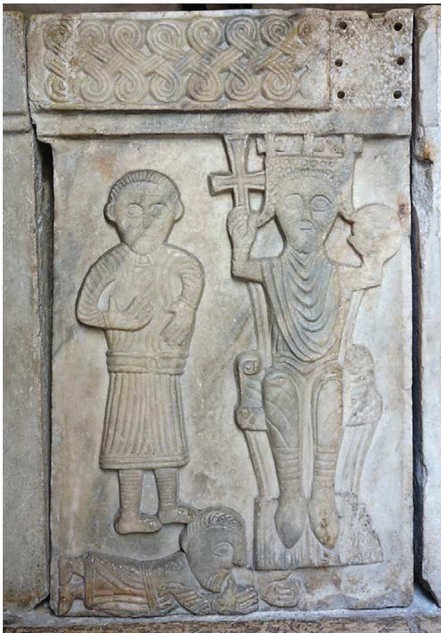
Abb. 2: Herrschen – Beraten – Gehorchen. Kroatischer Bildstein im Baptisterium Split (11./12. Jahrhundert), Foto: Bernd Schneidmüller.

riographie und Bildzeugnissen der ottonisch-frühsalischen Zeit (Orbis mediaevalis. Vorstellungswelten des Mittelalters 2), Berlin 2001; Carra Ferguson O'MEARA, Monarchy and Consent. The Coronation Book of Charles V of France . British Library MS Cotton Tiberius B. VIII, London/Turnhout 2001; Martin KINTZINGER, Symbolique du sacre, succession royale et participation politique en France au XIV e siècle , in: Francia 36 (2009), 91–111; Andreas BÜTTNER, Der Weg zur Krone. Rituale der Herrschererhebung im spätmittelalterlichen Reich , 2 Bde. (Mittelalter-Forschungen 35), Ostfildern 2012; Rudolf SCHIEFFER, Die Ausbreitung der Königssalbung im hochmittelalterlichen Europa , in: Matthias BECHER (ed.), Die mittelalterliche Thronfolge im europäischen Vergleich (Vorträge und Forschungen 84) , Ostfildern 2017, 43–80. – Zum Vergleich Daniel SCHLEY, Herrschersakralität im mittelalterlichen Japan. Eine Untersuchung der politisch-religiösen Vorstellungswelt des 13.–14. Jahrhunderts (Bunka Wenhua. Tübinger Ostasiatische Forschungen 23), Berlin 2014.